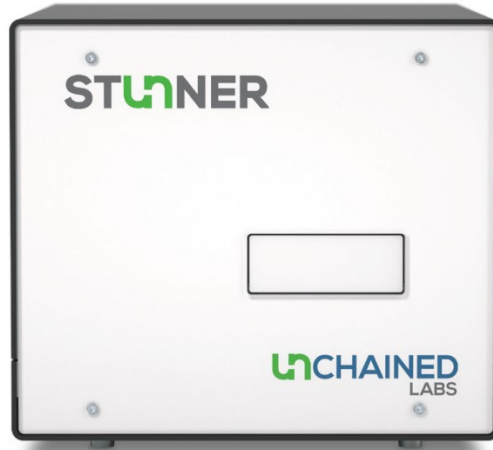
图 1: Stunner AF——LNP 定量与粒径表征的理想工具

本应用文章详细阐述 Stunner AF 如何简化 pDNA-LNP 的表征：无需表面活性剂、无需破坏样品，单次读取即可获得 5 项 CQA 的精确结果。